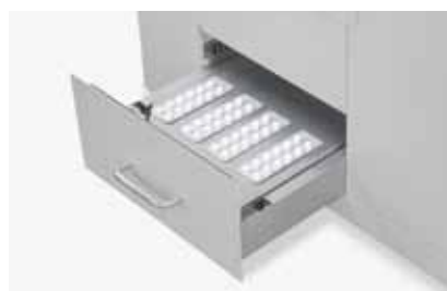
試料台にサンプルを置いて試験します

空冷式のキセノンランプを搭載、冷却水不要で設置が容易です。250×250mmの大型試料台、TM式反射鏡で全光線を効率よく照射し、試料面放射照度は均一です。照度は任意に調整できます。40,000～100,000lxモデルもあります(型式:XT1500)。